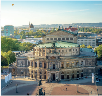
∞ Highlights ∞