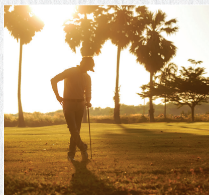
∞ Golfreisen ∞