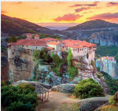
∞ Wanderreisen ∞