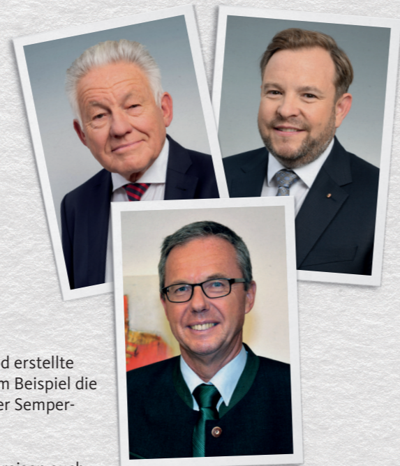
LH A. D. DR. JOSEF PÜHRINGER LANDESOBMANN

Wir hoffen, mit unserem Angebot Ihr Interesse zu wecken und freuen uns, Sie bei der einen oder anderen Reise begrüßen zu dürfen.