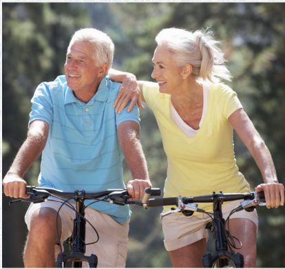
∞ Radreisen ∞