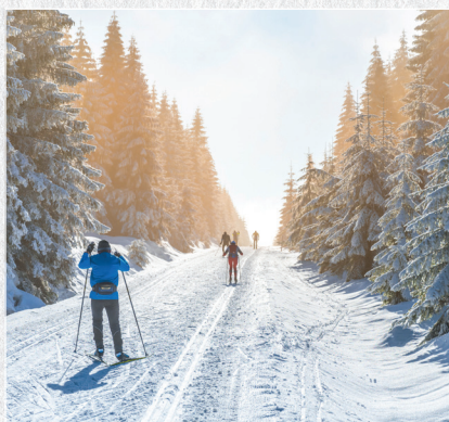
∞ Aktivwochen ∞