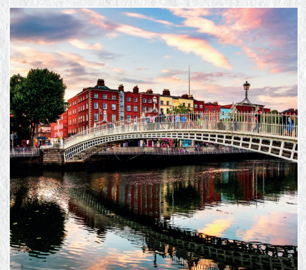
∞ Kulturreisen ∞